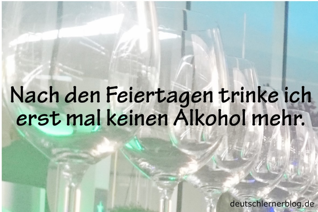
TYPISCHE SÄTZE ZU WEIHNACHTEN